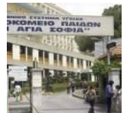
ΕΚΤΑΚΤΟ: Πανικός από έκρηξη