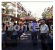
ΕΙΔΗΣΗ: Πότε μεταφέρεται η Λαϊκή αγορά