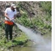
Καλό μήνα με... καλές ειδήσεις: Άρχισαν οι